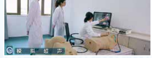
作为目前省内最大的医学模拟中心之一,我院医学模拟中心采用“院中院”的设计理念,从急诊到手术、从ICU到病房、从门诊到内镜中心,一应俱全,系统模拟了真实的医院环境还设置了省内首个“云教室”,实现远程互动教学、手术互动直播