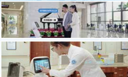
医院里随处可见的机器人朋友,导诊、患教……给患者带来更便捷的服务

65年厚积薄发,精彩蜕变。 新时代,科技风起云涌,直面机遇与挑战。 人工智能、大数据、物联网、5G……深度赋能医疗。 未来已来,互联、互通、共享,我院开启“智慧医院”新篇章!