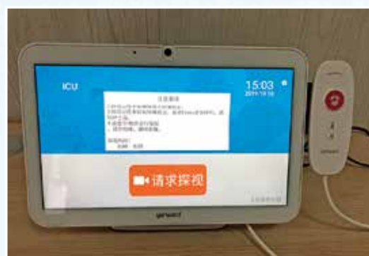
ICU移动探视系统,让患者和家属无障碍沟通