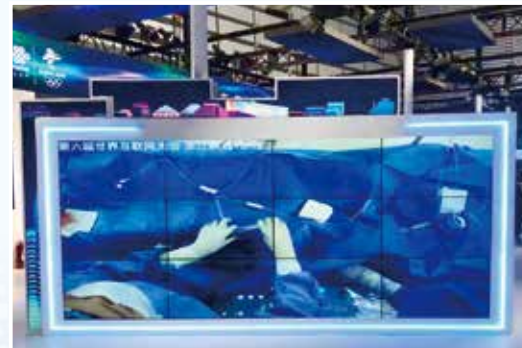
拥有西门子飞龙血管造影机(DSA)的杂交手术室内,一台介入手术正在进行中,画面被实时传输至乌镇互联网大会,作为5G手术示范例展示给各国参会人员