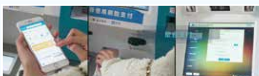
“刷脸”“两卡融合、一网通办”“聚合支付”……先进终端和技术的引进,患者只用一部手机,甚至直接“刷脸”,就可以轻松就诊