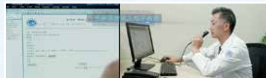
语音电子病例解放了医护人员的双手,将医护人员还给患者