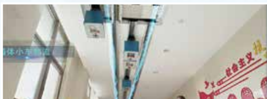
遍布门诊和住院大楼的宽箱体小车物流,是医院里的网红“劳模”