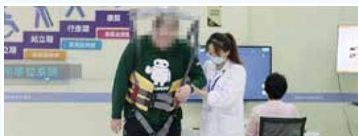
拥有省内最长天轨系统、三舱7门式高压氧舱治疗系统、整合AR技术的康复机器人等先进设备的康复治疗中心,实现康复医疗的大数据管理