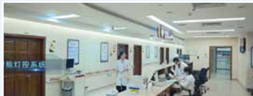
新型后勤管理软件和硬件设施的投入使用构建了高效的后勤管理