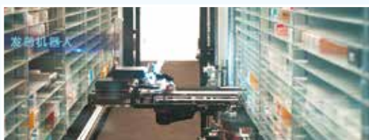
“黑科技”发药机器人,提高发药准确率的同时,实现了“药先到,药等人”的理想效果