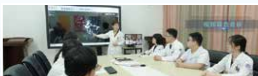
预约诊疗、移动支付、线上健康管理、远程会诊……互联网医院的构建,打通了院内院外、线上线下的壁垒,让患者少跑腿甚至不跑腿