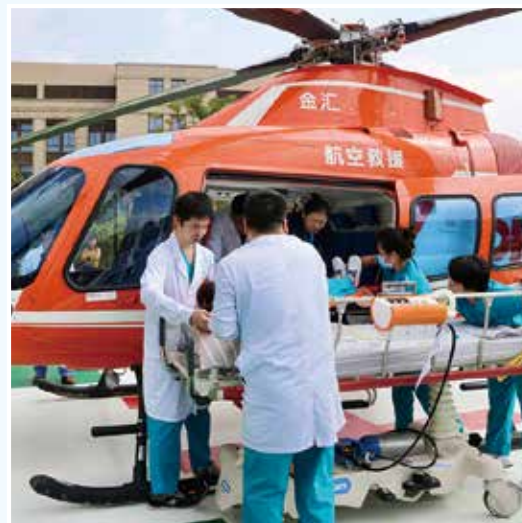
空中120正式启动,急救能力进一步提升