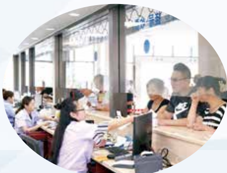
▲ 义诊当日挂号窗口