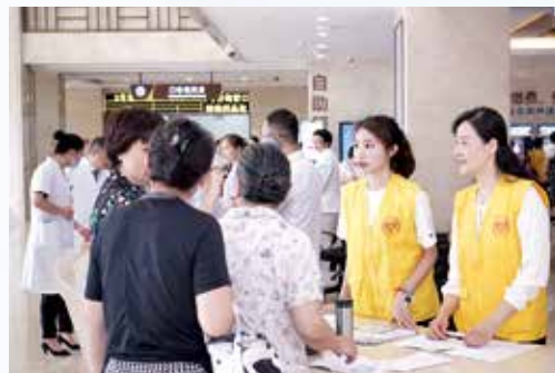
▲ 我院“五四”志愿者正在回答患者的咨询