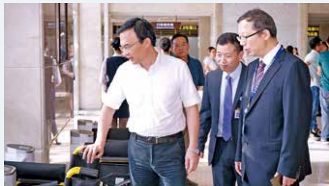
▲ 省卫生计生委党组书记、主任张平参观我院三墩院区门诊共享轮椅