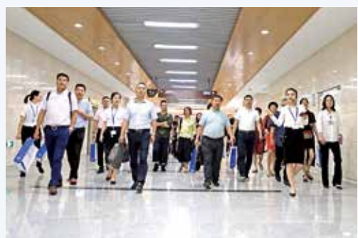
▲ 医共体成员单位代表参观我院三墩院区