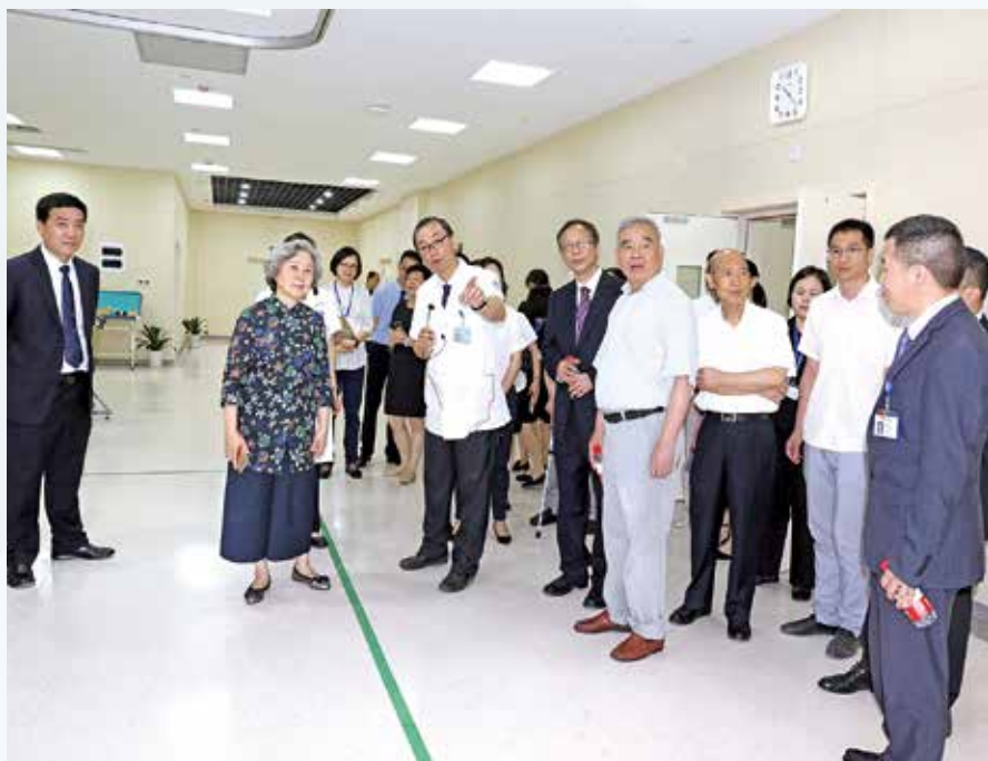
▲ 第十二届全国人大财经委副主任委员、原浙江省省长吕祖善、省老年学会会长、原省政协副主席徐鸿道以及原浙江省副省长盛昌黎等老领导参观三墩院区康复医学科